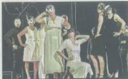
Le bal masqué du premier acte, chez les Capulet.

Après une pause de 20 minutes, le spectacle reprend son souffle, avec l'empoisonnement de Juliette, et Roméo qui la croyant